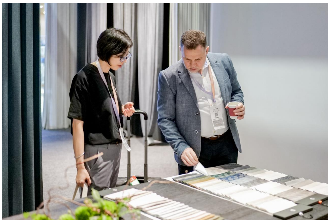
全球家紡買家首選的亞洲優質採購平台。

上海，2024 年 12 月 10 日。隨著今年展會 30 週年慶典的圓滿落幕，中國國際家用紡織品及輔料（秋冬）博覽會（以下簡稱 Intertextile 上海秋冬家紡展）將於 2025 年 8 月 20 至 22 日期間在國家會展中心（上海）揭開新的篇章。秉承著其領航亞洲家紡，推動行業互聯」的新展會口號，該全球商貿平台將再次集結國內外頂尖行業人士，借助其「紡織力量」在秋季採購旺季期間推動商業交流與合作，共創產業發展。